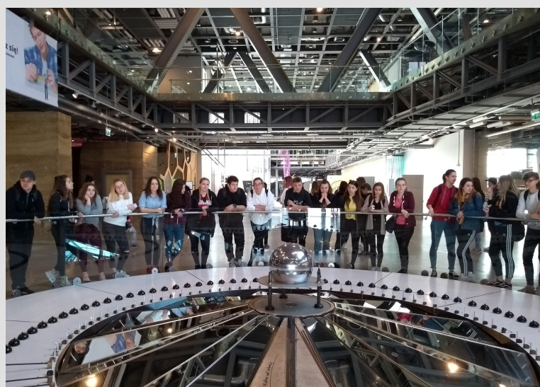
zdjęcie - warsztaty w Centrum Nauki Kopernik w Warszawie

kosmetologia, rehabilitacja, dietetyka, fizjoterapia, pielęgniarstwo, ratownictwo medyczne, technologia żywienia człowieka, biologia, chemia, biotechnologia.