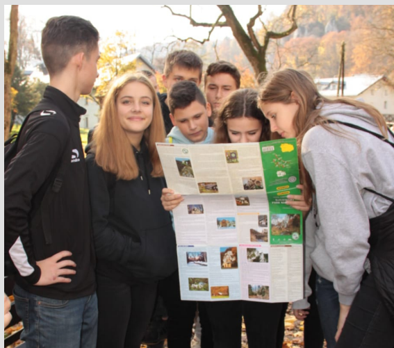
zdjęcie - lekcja w terenie w Ojcowskim Parku Narodowym

turystyka i rekreacja, animacje w turystyce, dziedzictwo kulturowe, geografia, organizacja imprez turystycznych, turystyka religijna