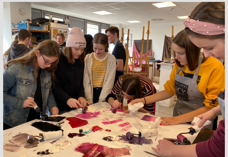
zdjęcie - zajęcia w pracowni graficznej

Stowarzyszeniem na Rzecz Rozwoju Osobowości Dzieci GRAAL