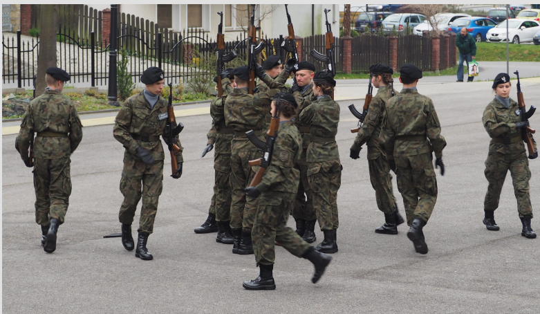
zdjęcie - Pododdział Reprezentacyjny XVI LO na Wojewódzkim Przeglądzie Klas Mundurowych