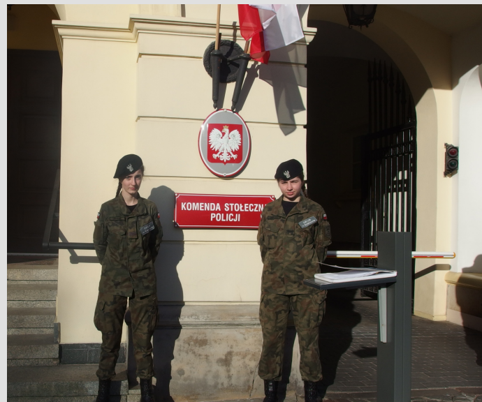
zdjęcie - wizyta w Komendzie Stołecznej Policji