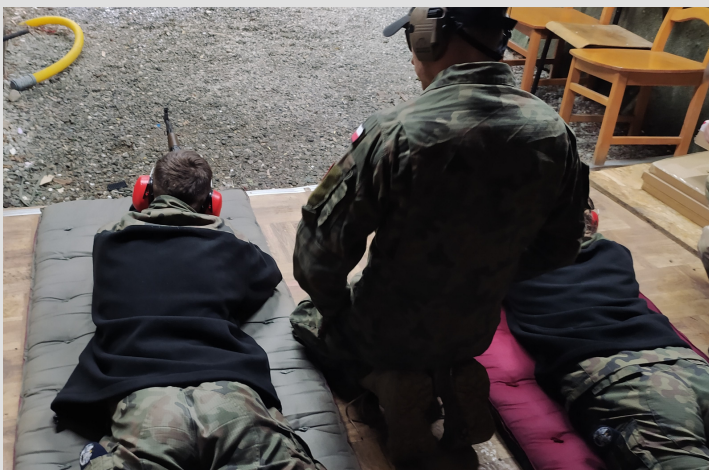
zdjęcie - zajęcia na strzelnicy w Suchej Beskidzkiej