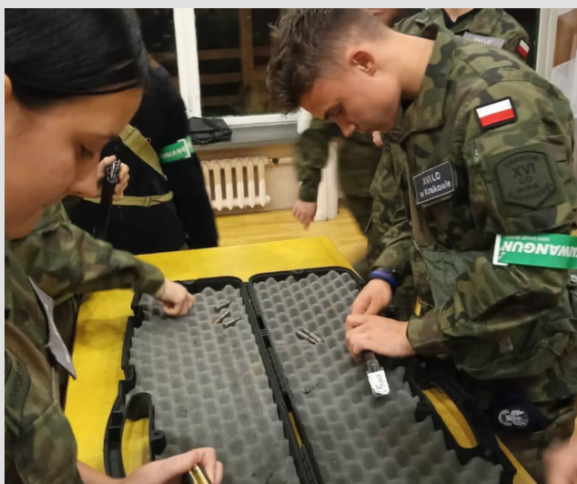
zdjęcie - obóz szkoleniowo-sportowy w Zawoi