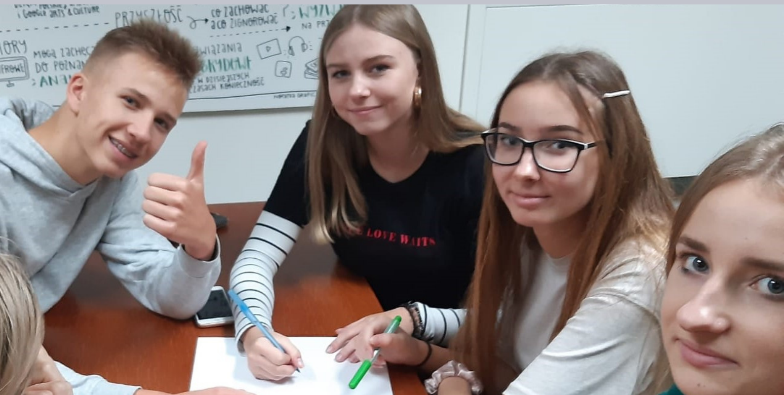
zdjęcie - warsztaty na temat dziedzictwa projekt "Youth on the trail of World Heritage"