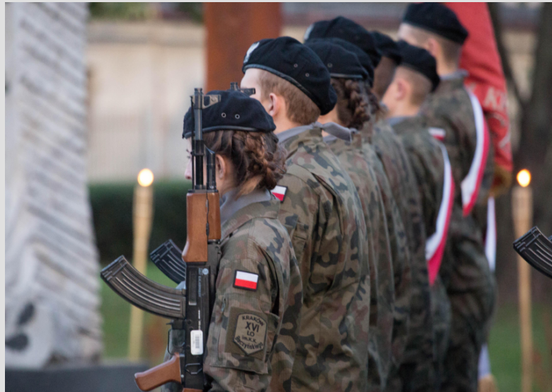
zdjęcie - Pododdział Reprezentacyjny XVI LO i poczet sztandarowy na uroczystym apelu z okazji Rocznicy Zbrodni Katyńskiej