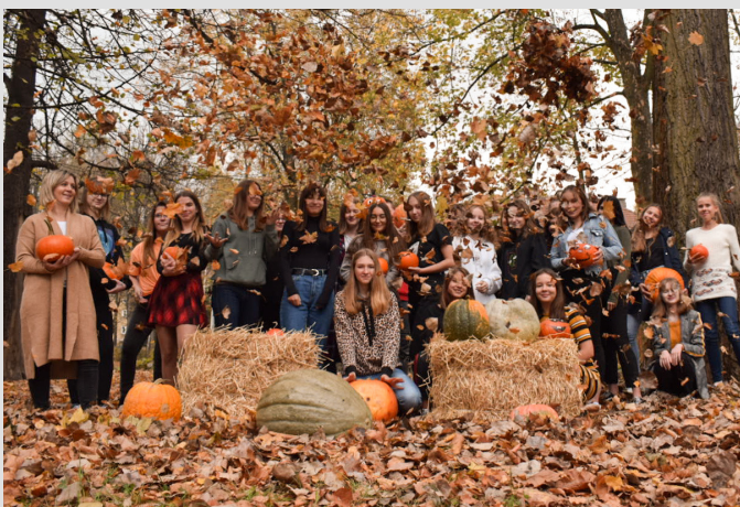
zdjęcie - tematyczna impreza charytatywna