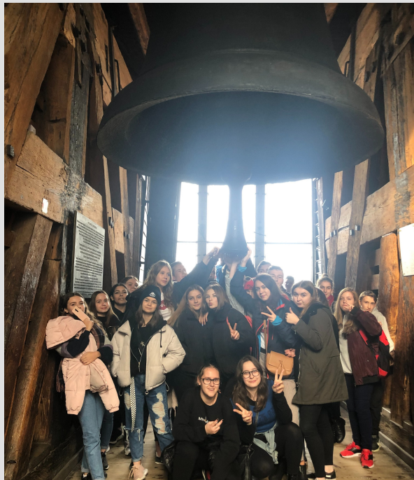
zdjęcie - zajęcia na Wawelu z historii sztuki i historii Krakowa