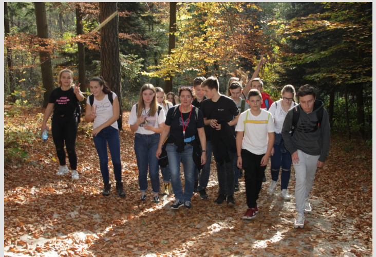
zdjęcie - zajęcia terenowe na Wyżynie Krakowsko- Częstochowskiej

Dla wszystkich, którzy wiążą swoją przyszłość z obsługą ruchu turystycznego w Krakowie i Małopolsce oraz dla zainteresowanych historią naszego regionu