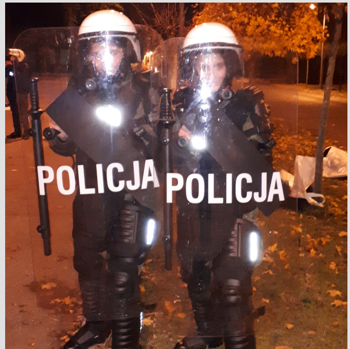
zdjęcie - dzień z życia kadeta w Legionowie

bezpieczeństwo narodowe, bezpieczeństwo wewnętrzne, politologia, logistyka, administracja, zarządzanie kryzysowe, wychowanie fizyczne w służbach mundurowych